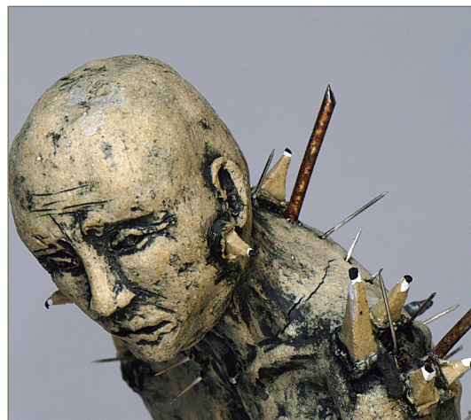
A Glimmer of Hope. Argile, teinture, glaçage.

de céramique. J'ai alors décidé de permettre une collision entre ces deux mondes en créant une exposition en solo de 16 œuvres que j'ai intitulée « Shards, Bone Deep ». Cet ensemble artistique explore les nombreuses relations que j'entretiens avec mon arthrite.