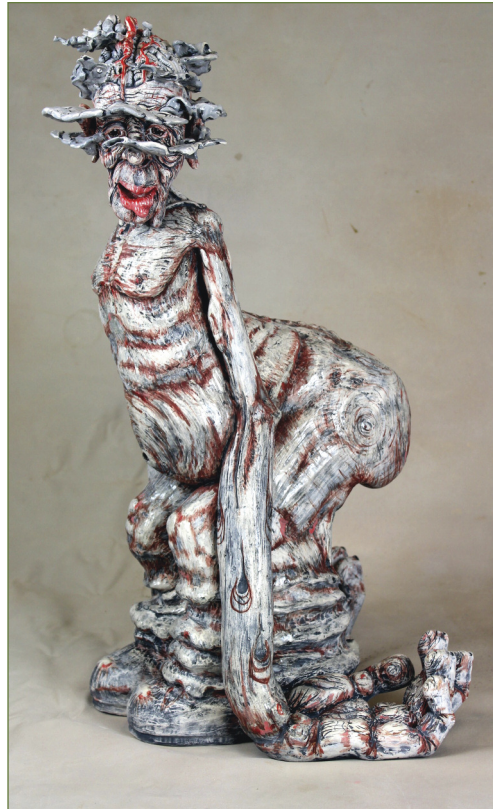
Fog of Fatigue. Argile, teinture, glaçage.