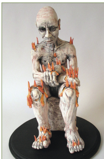
Burning Man . Argile, teinture, glaçage.