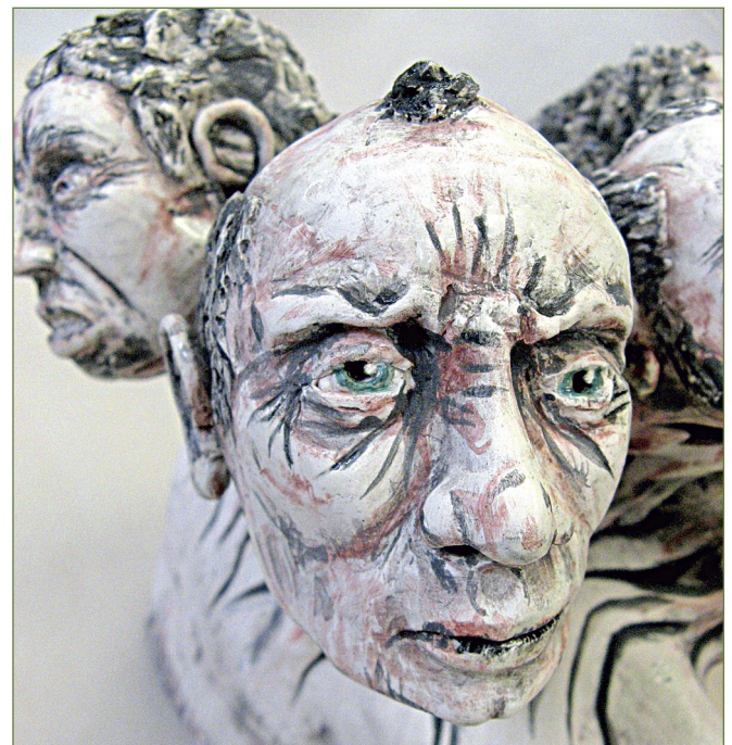
Gros plan, An Angry Joint . Argile, teinture, glaçage.

recherche Canada (ARC) m'a donné la chance de participer au processus de recherche en tant que consommateur