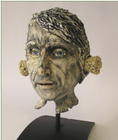
Postshock of Diagnosis. Argile, teinture, glaçage.

Me retirer du monde du travail signifiait aussi plus de temps pour redécouvrir un passe-temps que j'aimais beaucoup quand j'étais plus