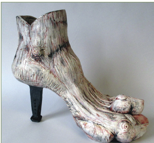
Healed. Argile, teinture, glaçage.